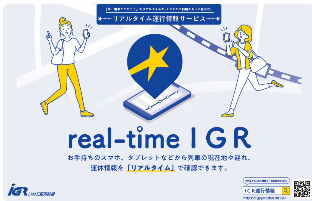
◆ 「real-time IGR」メイン画面