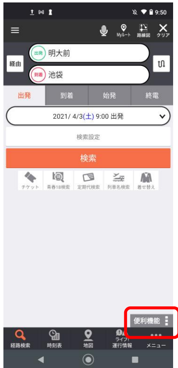
(1) アプリトップから「便利機能」を選択