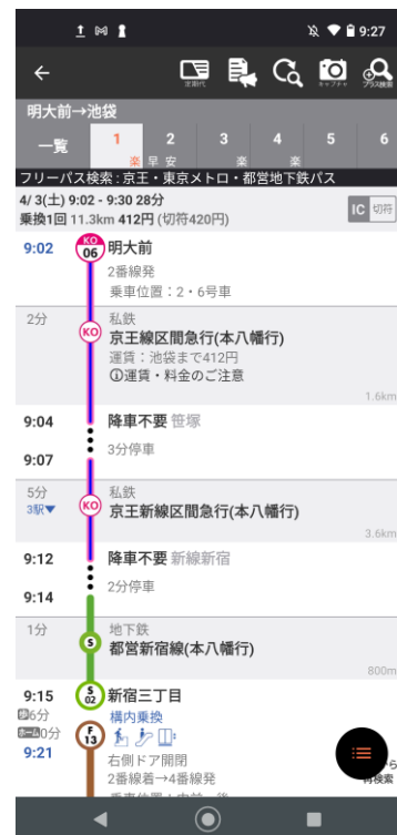
(4) 設定したフリーパスで利用可能な範囲に限定した検索結果を表示

※ 画面はAndroidアプリのものです。iOSアプリの場合、画面に若干の違いがあります。