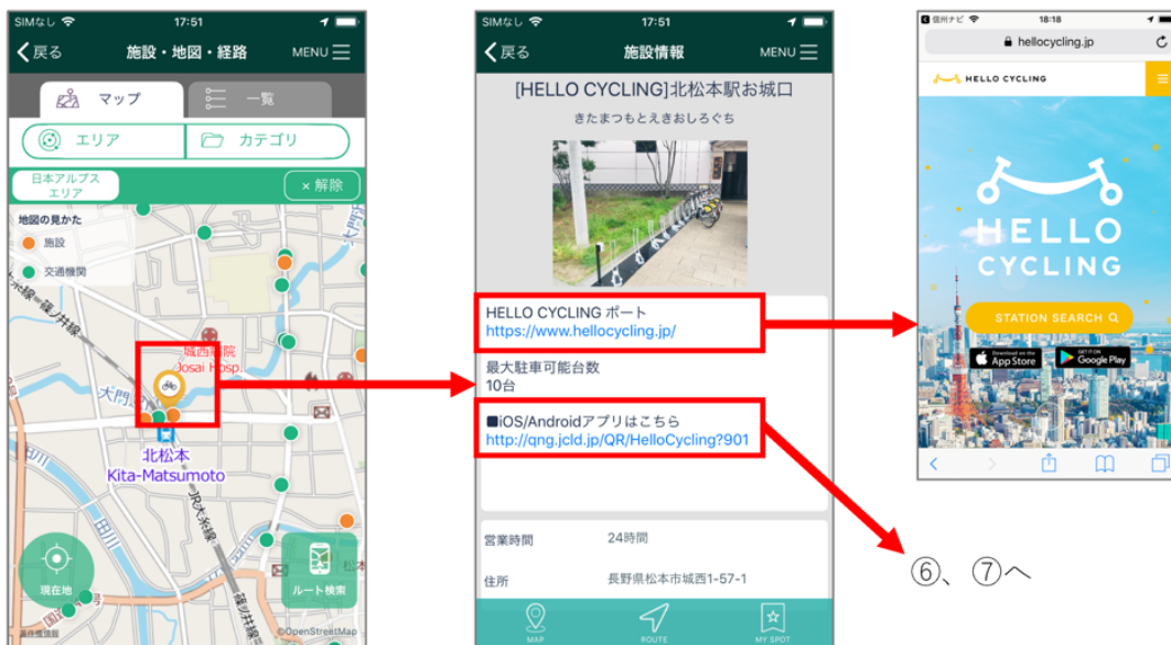
⑧：地図上に、ポートを自転車マークで表示。 ※アプリをアップデートしないと、他の施設同様オレンジの丸で表示されます。 ⑨：施設詳細画面ではポートの情報と各種リンクを表示します。 ⑩：「HELLO CYCLING」公式HPをブラウザで開きます。