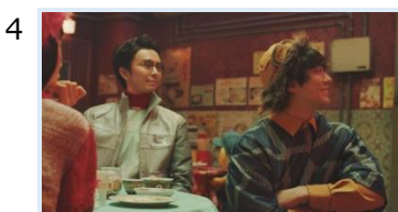
4 モンジュウロウ「って、ワリワリ？」