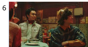
6 ドニマル「こんなアニメ出たいな～」