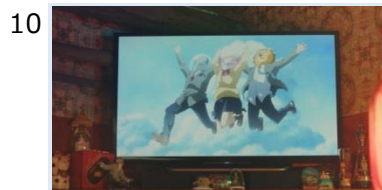
10 アニメのキャラクターが3匹に。