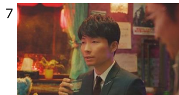
7 星P「じゃあ、みんなでやっちゃいますか…」