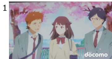
1 星野源の「サビエンス」がBGMとして流れているTVアニメ。

新TVCM「青春のどまんなか・スタート」篇 30秒版 ※15秒版、60秒（ロングバージョン）もあります