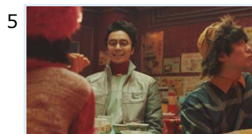
5 コスモフ「私もこんな青春記憶にないが…」