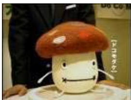
2005年 新キャラ登場篇 デビュー作です。