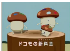
2005年 新料金のうた篇