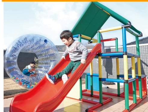
※安全性に配慮するため、床デッキと固定して利用します。

株式会社 innovation では 2010 年 11 月より、木造住宅に『瓦屋根と同等価格』から屋上リビングを導入できる「プラスワンリビング」を開発、コストアップ無しでも「家族が集える寛ぎ空間」を創出できることが大きな評価を受け、子育て世代を中心に全国 3,000 世帯以上の住宅に提供しています。