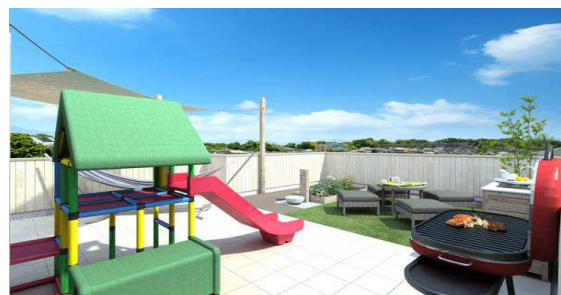
レンタル遊具を設置した屋上リビング(イメージ)

初年度は、遊びながら「はいはいする・ゆれる・登る・渡る・握る」といった全身運動を行なうことで体の発育を促す大型遊具 2 種類を計 100 個購入し、プラスワンリビング購入者に往復送料(一律 9,800 円:税別)の負担のみで 3 ヶ月間貸し出します。個々の遊具の定価は 10 万円程度と個人購入するには高価なものですが、屋上を楽しむ人々で共同シェアすることにより、価値あるものを子どもの成長に合わせて「必要な時期」だけ、低コストで利用することが可能になります。更に、居室内に遊具置き場のスペースを設けなくて良いところも大きなメリットです。