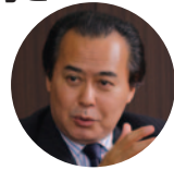
経済ジャーナリスト 財部誠一氏

金融、経済誌に多く寄稿し、TVやラジオでも広く活躍中の気鋭のジャーナリスト、財部氏が、現在の日本経済について、勝ち残る企業経営について、熱く語ります!!