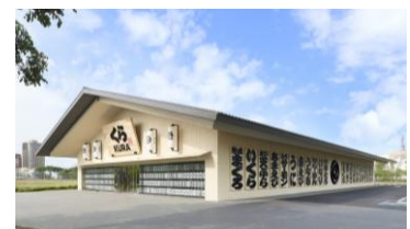
グローバル旗艦店 高雄時代大道

2014年に台北市内に初出店し、2020年9月にTaipei Exchangeへ上場。現在63店舗(2026年5月末時点)を展開。2023年には海外初のグローバル旗艦店を高雄市にオープンし、連日多くのお客様でにぎわっています。