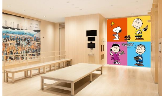
《グローバル旗艦店 なんばパークスサウス》