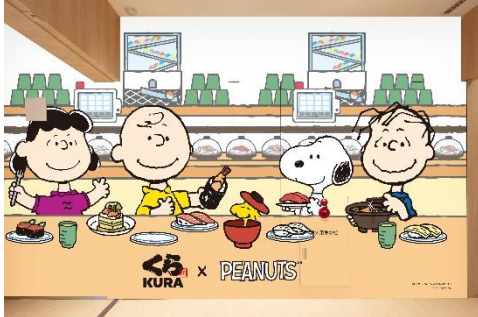
《グローバル旗艦店 原宿》