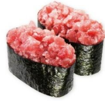
国産天然本まぐろねぎまぐろ 280円 販売期間:販売中~6月7日(日)