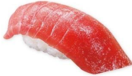
国産天然本まぐろ中とろ(一貫) 280円 販売期間:5月29日(金)~6月7日(日)