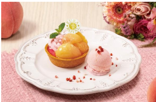
恋色ももタルト 550円 販売期間:5月29日(金)~6月25日(木) ※お持ち帰り不可 ※各店舗1日数量限定 ※「グローバル旗艦店原宿」ではお取り扱いしておりません。