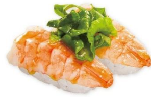
えび バジルサラダ 160円 販売期間:5月29日(金)~6月7日(日)

近畿大学と、アセロラ事業を手掛ける大手食品メーカーの株式会社ニチレイフーズが共同開発。プリとヒラマサの交配により生まれたプリヒラにアセロラの果皮や種などを配合した餌を与えることで、抗酸化作用により鮮やかな身色を保ち、通常のプリに比べ、ビタミンCは約66倍、ビタミンEは約26倍 ※ 含まれています。歯ごたえの良さと、旨みは残しつつ、あっさりとした味わいが特長です。