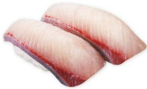
アセロラぶりひら 300円 販売期間:5月29日(金)~6月21日(日)