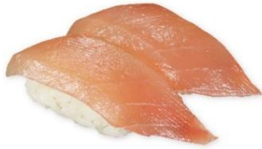
ピンクロ 115 円