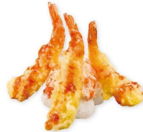
えび天マウンテン 300 円