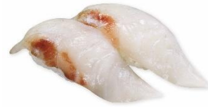
国産天然 黒鯛 180 円