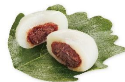
昔ながらのかしわ餅 115 円

ポテトやハンバーグ、エビ天にたまごのお寿司と、お子様に人気のメニューを一緒に盛り付け、旗のピックを添えた特別な一皿です。