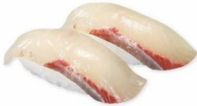
【鹿児島県産】レモンひらまさ 300 円