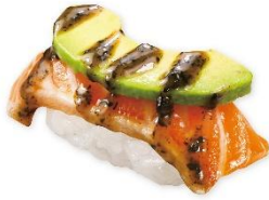
トリュフ生サーモン(一貫) 200 円