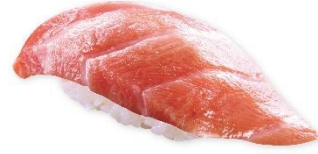
熟成大とろ(一貫) 380 円