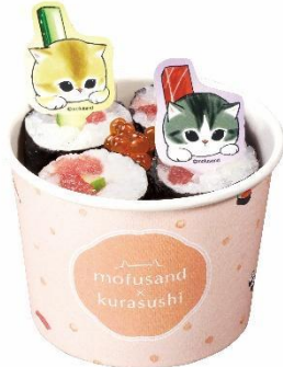
にゃんこカップ寿司 400 円