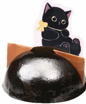
くろにゃんチョコケーキ 480 円