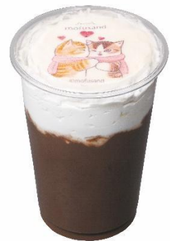
にゃんにゃんチョコミルク 480 円

mofusand のキャラクター“くろにゃん”をイメージした商品。サクサク食感のクランブルの上にキャラメルムースがあり、表面はショコラでコーティングしたドーム型ケーキです。ケーキに三角のチョコをトッピングすることで、猫の形を再現しました。