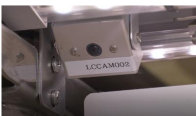
④レーンに取り付けたカメラで取られた お皿を自動的にカウントするセルフチェック (コンタクトレス)