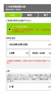
③来店時間と人数を選択