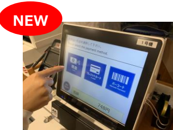
⑤セルフレジ (コンタクトレス+タッチレス)