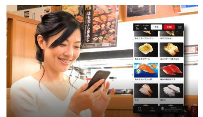
③スマホで注文 ※自身のスマホと連動して注文可能 (タッチレス)