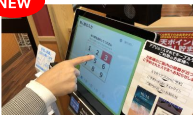
①セルフ案内 (コンタクトレス+タッチレス)