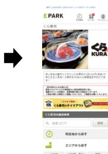
②ご利用の店舗を選択