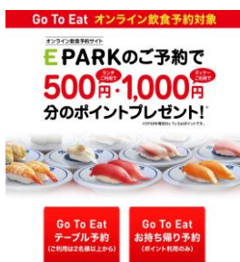
① くら寿司公式アプリより「Go To Eat テーブル予約」を選択

〈テーブル予約までの流れ(イメージ)〉 ※詳細は、くら寿司公式アプリ内にてご確認ください。