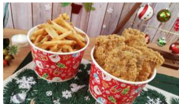
<お持ち帰り専用：クリスマス特別仕様のバレル>

くら寿司初の販売となる「フライドチキン」は、ジューシーかつ上質な鶏モモ肉のみを厳選して使用。独自配合した特製スパイスで味に深みを加えました。特製の衣を使用し、注文を受けてから店舗で揚げることで、カラッと揚げた衣のサクサクとした食感と、あふれる肉汁、そして特製スパイスが絶妙に絡み合う、くら寿司オリジナルのフライドチキンが完成しました。クリスマスの期間でしか味わえない本商品を、是非この機会にお楽しみください。また、同時に発売する「メガモリポテ」は、くら寿司の大人気商品「もりもりポテ」をクリスマス特別商品として、通常サイズの1.5倍に“メガ盛り”し、価格を据え置いてご提供します。