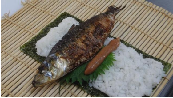
大羽の真鰯をまるごと使用