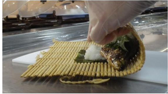
恵方巻は店舗で一本ずつ手巻きします