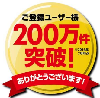
登録ユーザー200 万件突破記念ロゴ

モノタロウオリジナル 7 色 T シャツは、当社のオリジナルマスコットキャラクター「モノタロウ侍(ざむらい)」の描き下ろしイラストが施された完全生産限定の特製 T シャツです。カラーバリエーションは空(もく)グレー、ライトブルー、ロイヤルブルー、レッド、デイジー、グリーン、ホホワイトの 7 色、サイズは S、M、L、XL の 4 サイズをご用意し、男性/女性を問わず、作業着としてはもちろん普段着にも使える T シャツです。