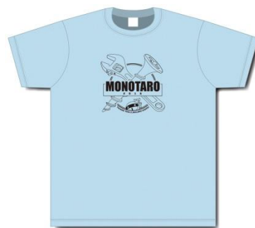
モノタロウオリジナル7色Tシャツ(ライトブルー)

当社では、オリジナル T シャツの ¥0 販売を通じ、創業以来多くのユーザーの皆様にご愛顧いただいた感謝をお伝えすると同時に、これからもより長く、そしてより多くの方にご利用いただけるよう、あらゆる現場のニーズに応え、ユーザー利便性の向上に取り組んでまいります。