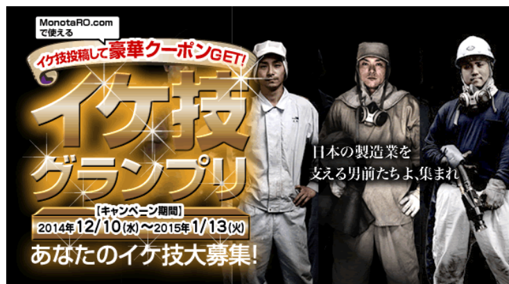
「イケ技グランプリ」キャンペーンサイト

工業用間接資材※通信販売最大手の株式会社 MonotaRO(モノタロウ)は、大阪市の中小企業支援拠点「大阪産業創造館」が主催する「日本のものづくりを担う若手採用応援プロジェクト」に参画し、2014年12月10日(水)から、当社の特設サイトにて製造業を中心として働く若手従業員の優れた技術「イケ技」の動画コンテスト「イケ技グランプリ」を特設ページで開催いたします。