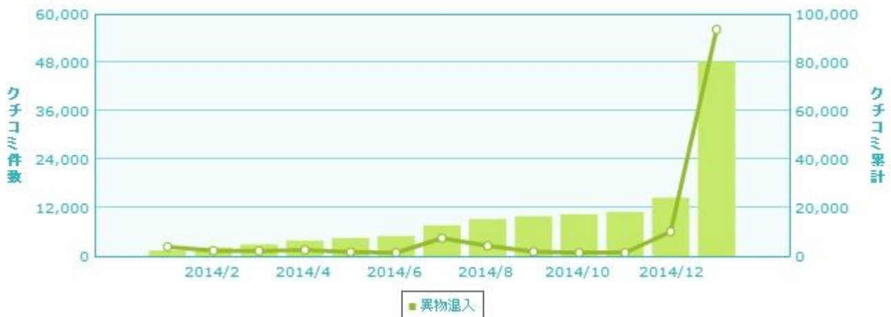
【(図1)「異物混入」のクチコミ数推移 ※クチコミ@係長調べ】

ソーシャルメディア上でも、異物混入に関する言及数は急増し、消費者の食の安全に対する意識がかなり高くなっていることがうかがえます（図1）。