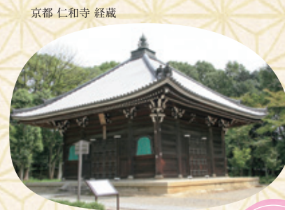
京都 仁和寺 経蔵

文化遺産を学ぶ旅、 その保存と活用を目指して 古より継承される 三都(京都、奈良、大津)文化財の魅力に迫る