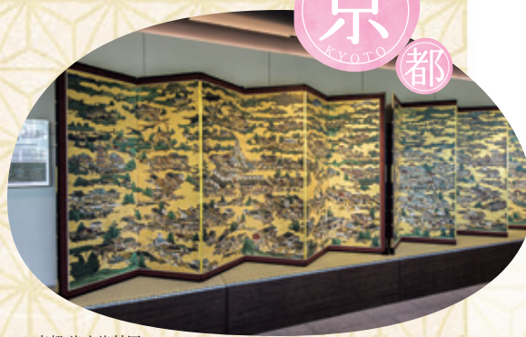
京都 洛中洛外園