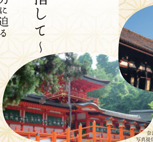
興福寺(東金堂と五重塔)