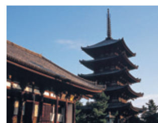
興福寺（東金堂と五重塔）