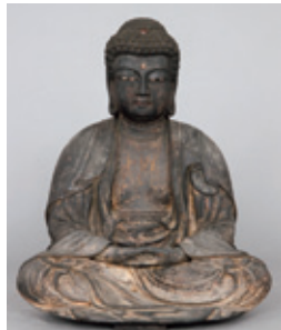
釈迦如来坐像（楽浪文化財修理所）