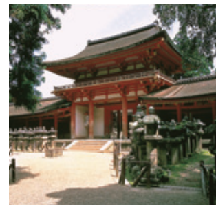
春日大社（南門）