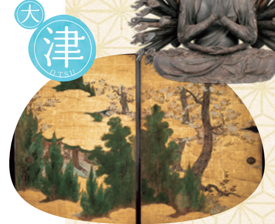
楽浪文化財修理所 千手観音坐像