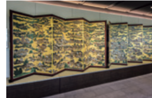
午前座学Ⅰ・京都 洛中洛外図