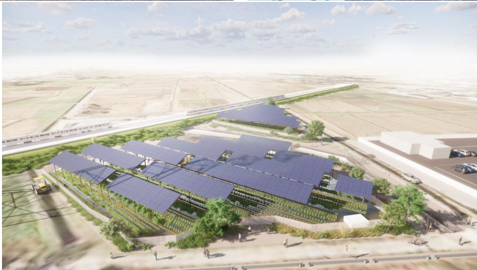
リエネソーラーファーム東松山 太陽光発電所の全景（イメージ）