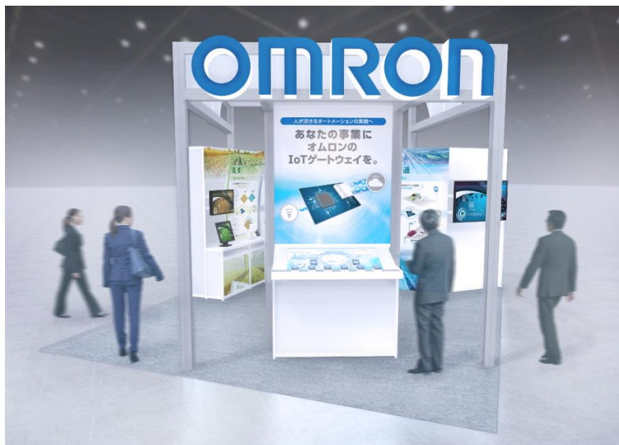
【オムロン ブースイメージ】

オムロンブースでは、機器からの安定したデータ送信・接続を可能とする通信ネットワークを構築し*2、農業・エネルギーインフラ・交通・工場の分野におけるオートメーションの実現に貢献するソリューションを展示します。ハードウェアやソフトウェアをプラットフォーム化させ、さまざまな通信規格に対応したモジュールとして提供することで、現場での容易な導入を可能とするアプリケーションをご覧いただけます。