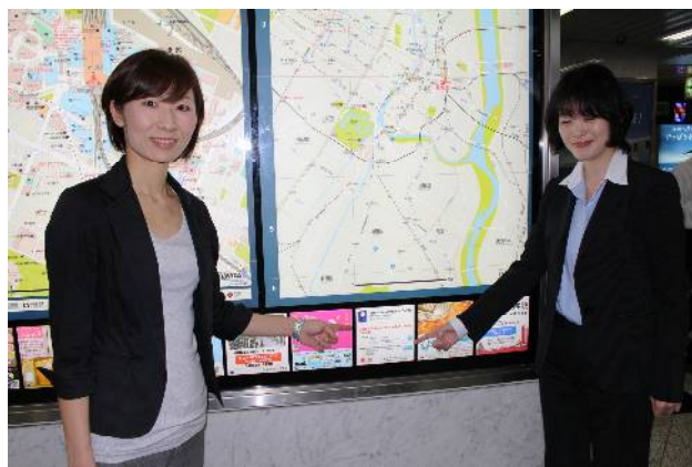
【訪日外国人旅行者に対するスムーズな誘導に期待】