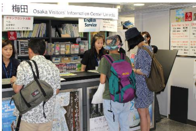
【観光案内所の様子】