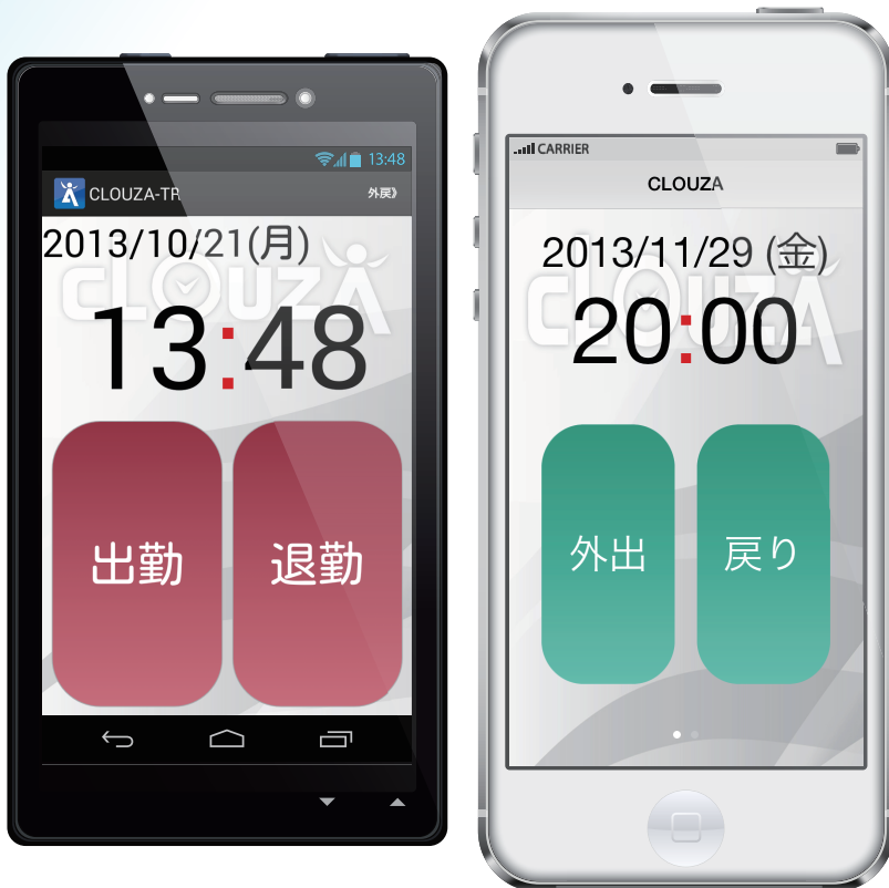
(出勤・退勤打刻画面)