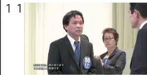
(01" 08f/19" 03f)