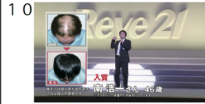
(01" 10f/17" 25f)