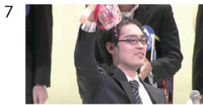
(01" 19f/11" 03f)