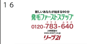
(02" 09f/30" 00f)