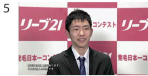
(01" 27f/07" 28f)