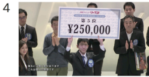
(01" 10f/06" 01f)