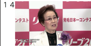
(01" 23f/23" 28f)