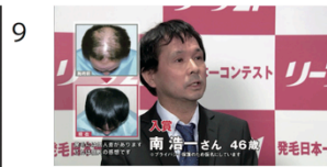
(01" 17f/16" 15f)