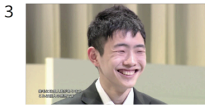
(01" 22f/04" 21f)

いつもつるつるだった ところが、少しざらついた 感じがしてきんで、 おっ！って思いました。