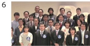
(01" 16f/09" 14f)