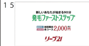
(03" 23f/27" 21f)