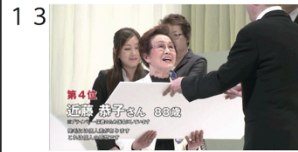
(01" 22f/22" 05f)