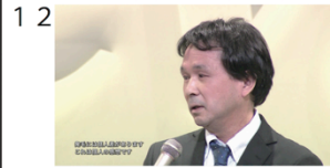
(01" 10f/20" 13f)