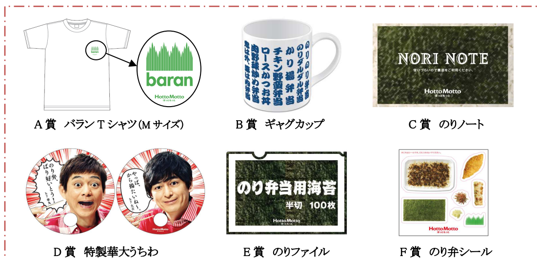
A 賞 バラン T シャツ (M サイズ)

パビリオンとなる「ほっともっと」各店舗では、A1 サイズの特大パンフレットを配布するとともに、特製ポスター数種や大型タペストリー、横断幕などで店内を盛り上げます。さらに、弁当をご購入いただいた方全員に、『バラン T シャツ』や『のりノート』など 6 種類のオリジナルグッズを総計 365 万人にプレゼントする、空くじなしのスクラッチくじ『ベンパクじ』を、弁当一食につき一枚ずつ配布するキャンペーンも実施いたします。※