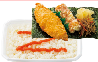
博多辛子明太のり弁当

“新型のり弁”は、ごはんと海苔の間のおかか昆布を、本場・博多のピリっと辛い明太子や醤油を加えた和風仕上げのツナマヨネーズに変えることで、これまでにない新たなおいしさを引き出しました。あわせて、タルタルソースをプラスした『博多辛子明太のりタルタル弁当』『ツナマヨネーズのりタルタル弁当』410円(税込)と、メンチカツ、白身フライ、から揚げの組み合わせの『博多辛子明太特のりタル弁当』『ツナマヨネーズ特のりタル弁当』490円(税込)も新発売いたします。