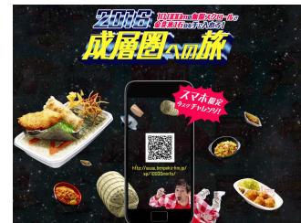
スマートフォン限定ゲーム