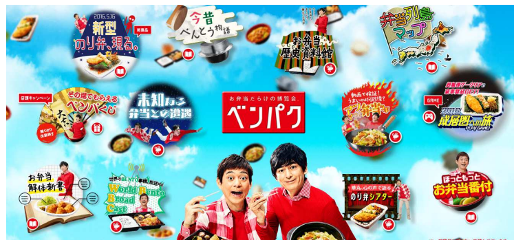
特設 web サイトイメージ

さらに、スマートフォン限定で遊べる、10,000m 上空に浮かぶ“新型のり弁”を目指して画面をスクロールするゲーム『2016 成層圏への旅』では、クリアした方の中から、『金芽米 1 石 (180kg)』を 1 名様に、『ほっともっとお食事券 500 円分』を 100 名様にプレゼントいたします。