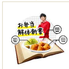
読み物 5 編