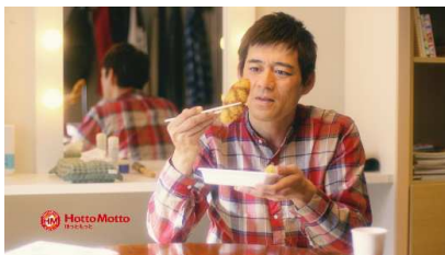
動画 5 本