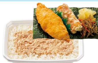
ツナマヨネーズのり弁当