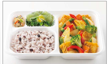
いかと彩り野菜のカレー炒め 550円(税込)