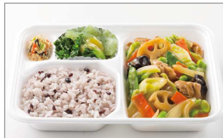
豚肉とたっぷり野菜の八宝菜 550円(税込)