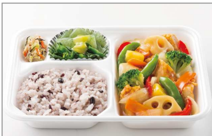
鶏肉と野菜のさっぱり甘酢あんかけ 550円(税込)

一般的な成人の1日の摂取カロリーは約1,800~2,200kcal、塩分摂取量は男性8g未満、女性7g未満が目安であるとされています。日々の食事に「ほっともっと」の『タニタ監修弁当』をとり入れていただくことで、無理なくカロリーや塩分を抑えることができます。