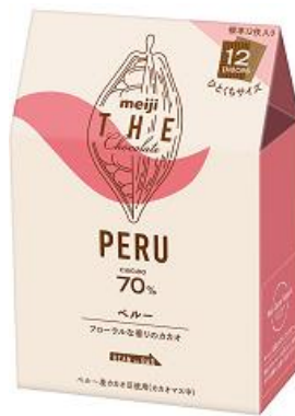
「明治 ザ・チョコレート ペルーカカオ70%」