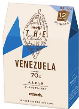
「明治 ザ・チョコレート ベネズエラカカオ70%」