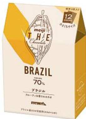
「明治 ザ・チョコレート ブラジルカカオ70%」