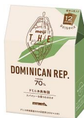
「明治 ザ・チョコレート ドミニカ共和国カカオ70%」