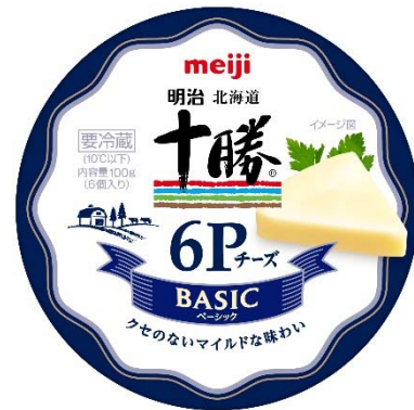
「明治北海道十勝 6Pチーズ ベーシック」 希望小売価格:330 円(税別)/356 円(税込)

近年、国内におけるチーズの消費量は拡大しており、2017 年度は図の通り過去最大を更新しました。要因として、おつまみやおやつとしてそのまま食べる機会や、食シーンの多様化による料理への使用が増えたことが挙げられます。