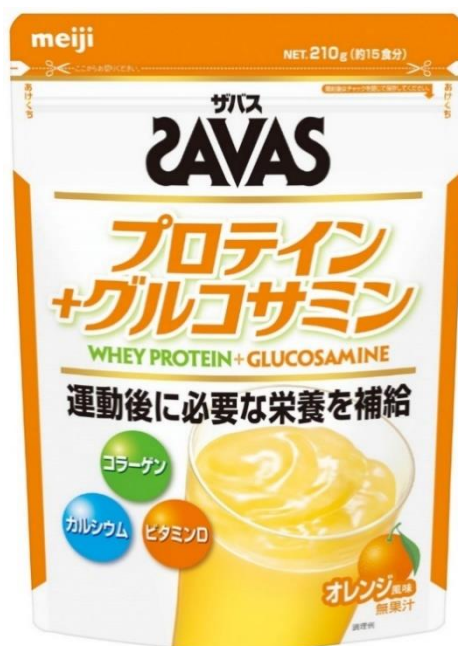
「ザバス プロテイン プラス グルコサミン 15食分」 希望小売価格:1,500円(税別)/1,620円(税込)

2017年度の プロテイン市場は約300億円 ※ 2 となり、10年前と比較し 約3倍と大きく伸長 しています。この市場拡大の背景には、従来のアスリート層のユーザーに加え、一般層にまでニーズが拡大しているためです。一般層のなかでも、 中高年層においては、ロコモティブシンドロームやサルコペニアなどの関心の高まりを背景に、“健康”や“体力維持”などを目的に「運動する中高年」が、今後も増加すると見込まれます。 このことから、中高年層のプロテインをはじめとしたスポーツサプリメントの摂取ニーズは、一層拡大していくと考えられます。