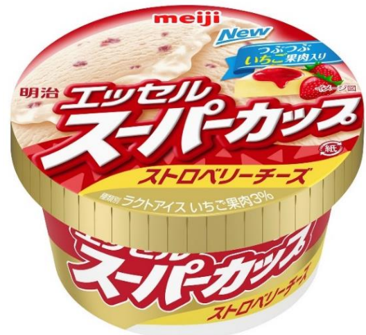
「明治 エッセルスーパーカップ ストロベリーチーズ」 メーカー希望小売価格:130円(税別)・140円(税込)

本商品の発売を通じ、「明治 エッセルスーパーカップ」のさらなるブランド拡大と、アイス市場の活性化を図ってまいります。