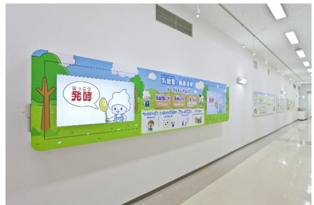
【乳酸菌と健康コーナー】