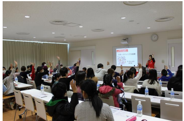
【食育セミナーの様子】