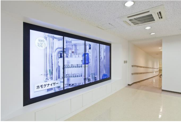
【バーチャル工場見学】