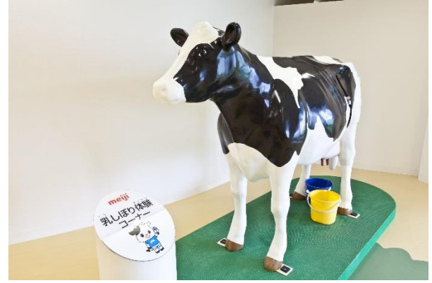
【乳しぼり体験コーナー】