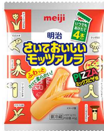
「明治さいておいしいモzzarella 4本入りミックスピザ味」 希望小売価格:230円(税別)/248円(税込)

近年、さいて食べるチーズであるSTRINGチーズ市場が拡大しています。当社は2016年3月に、「明治さいておいしいモzzarella4本入り」を発売し、STRINGチーズ市場に参入しましたが、図の通り市場の活性化に貢献し、当社の調査では16年度で過去最大を更新しました。