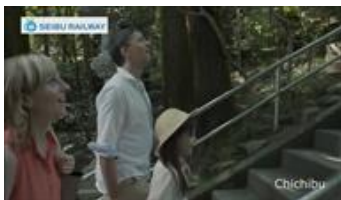
夏篇 (秩父・軽井沢)