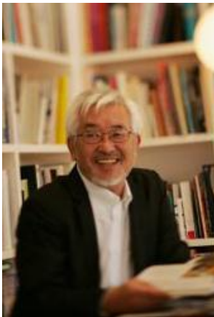
内田 繁 Shigeru Uchida インテリアデザイナー

日本料理「しのぶの里」は、その季節・時期でしか味わえない旬の食材を使った日本料理を、厳選した地酒とともに、寛ぎの空間の中で味わっていただきます。