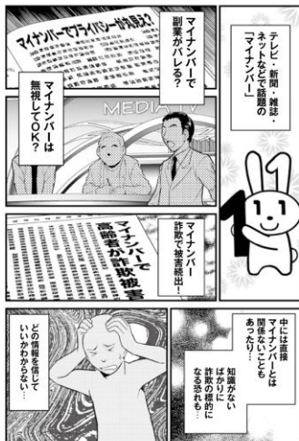
[01] 寺島らたけと、マイナンバーってどんな制度？ 006