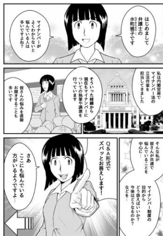
007 [01] 寺島らたけと、マイナンバーってどんな制度？