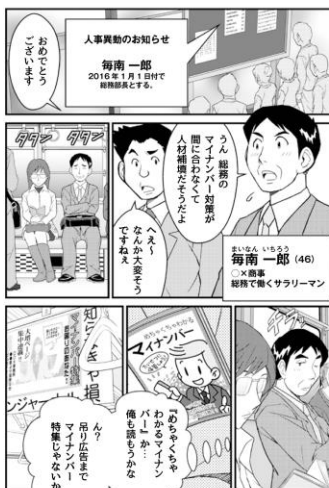
[01] 寺島らたけと、マイナンバーってどんな制度？ 008