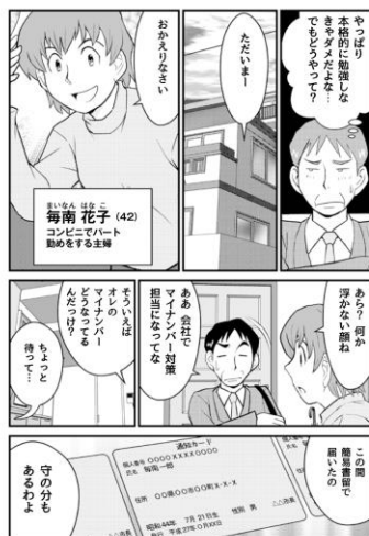
009 [01] 寺島らたけと、マイナンバーってどんな制度？