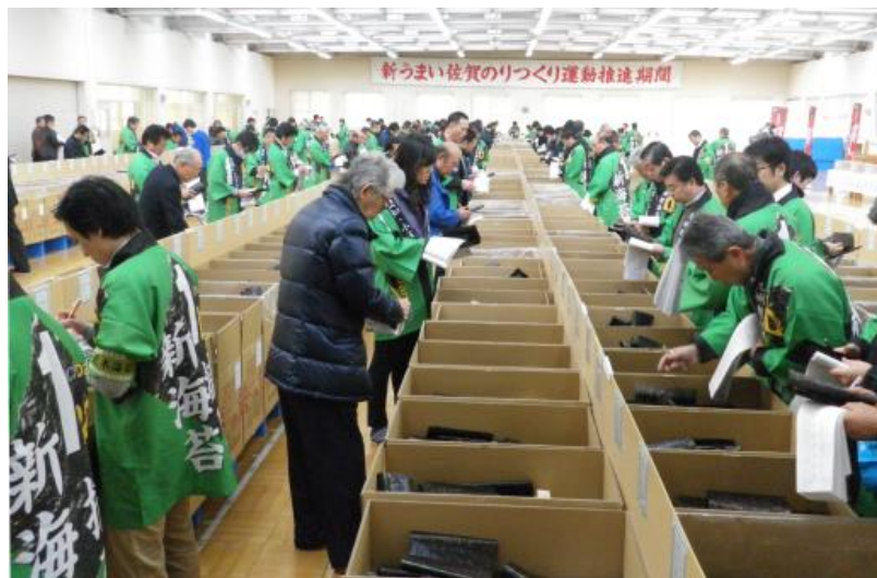
平成 27 年の初競り風景

佐賀県が今年 7 月から県産品PRを目的に展開している、朝ごはんをテーマにしたプロモーション企画『あさご藩』は、佐賀海苔が朝食のメニューとして全国で親しまれていることをヒントに誕生したもので、配信開始とともに話題を呼んだ豪華時代劇ムービー『あさご藩 ～a saga breakfast saga～』にも登場しています。