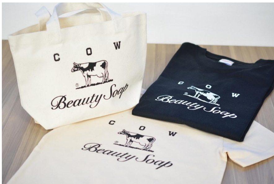
（画像：シルクスクリーンで印刷したTシャツ・トートバッグ）

今年で3回目となる本イベントは、大阪・城東区の活性化と、地域の方に喜んでいただくことを目的に開催され、毎年多くの来場者で賑わう人気企画です。当社は、カウブランド赤箱のロゴを“身近なアイテム”に印刷できるシルクスクリーン印刷体験への協力と、イベント限定コラボアイテムの来場者プレゼントで盛り上げます。