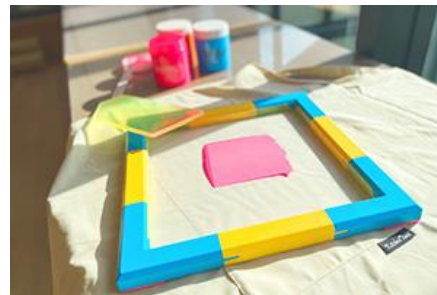
シルクスクリーン印刷