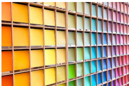
ペーパーギャラリー