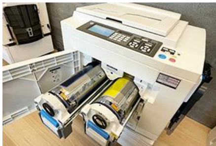
リソグラフ印刷機