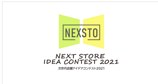
コンテスト メインビジュアル

丹青社は本コンテスト開催を通して、より多くの方に新たなお店づくりについて考える機会を創出し、セレクトショップやレストランチェーン等の丹青社のクライアントを審査員に迎え、丹青社のデザイナーらとともに、優れたアイデアを取り入れた店舗具現化の可能性を探ります。時代を読む目を力に空間づくりのフィールドを拡げ続けてきた丹青社が、クライアントと一緒に次世代店舗を生み出すオープンイノベーションを推進し、さまざまな空間づくりを手がける総合ディスプレイ業だからこそ生み出せる、これからの空間への期待感の醸成を目指します。