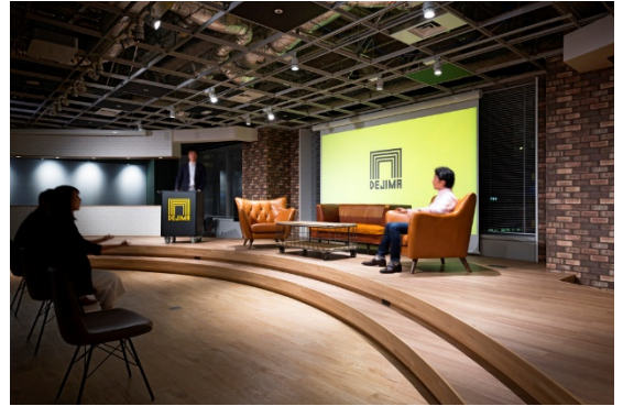
「Innovation Space DEJIMA」

「Innovation Space DEJIMA」 ( https://dejima.space/ ) は、2017年にCTCが開設した、お客さまとの新規ビジネスアイデアの創出や各種ワークショップ・ミーティング等を開催するオープンイノベーションのための専用スペースです。丹青社は同施設の設計・施工を担当しました。また、丹青社はDEJIMAパートナーにも加盟しており、イノベーション創出に向けた活動を行っています。今回の取り組みもその一環として、変化する環境に合わせた共創の場づくりによりイノベーション創出を促進することをめざして実施するものです。