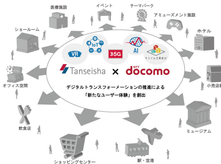
2社の協業のイメージ

駅・空港などの交通拠点、ミュージアム、工場見学施設などの観光施設、ショールームでの協業を開始し、順次オフィス空間、ショッピングセンター、店舗、飲食店、宿泊施設、アミューズメント施設、医療施設、イベントなどの他分野へ展開する予定です。