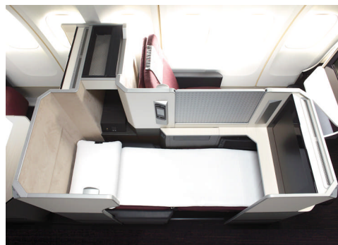
シートの上にエアウィーヴをセットした状態