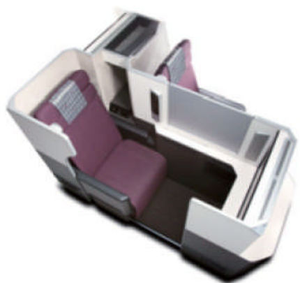
JALビジネスクラスシート「SKY SUITE」