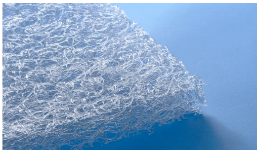
ウィーヴァージャパンが開発した新素材 3次元構造の極細繊維状樹脂