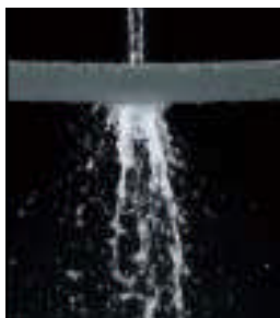
優れた通気性と水洗い可能の特長