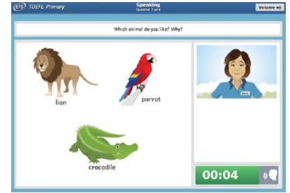
TOEFL Primary® Speaking 画面サンプル

海外の大学での講義に対応できるアカデミック英語の力は一朝一夕にはつきません。TOEFL Primary® Speaking と TOEFL Junior® Speaking は英語圏の小学校・中学校・高校の学校生活を主な題材としており、受験者の英語運用能力の伸びを測定することが可能です。