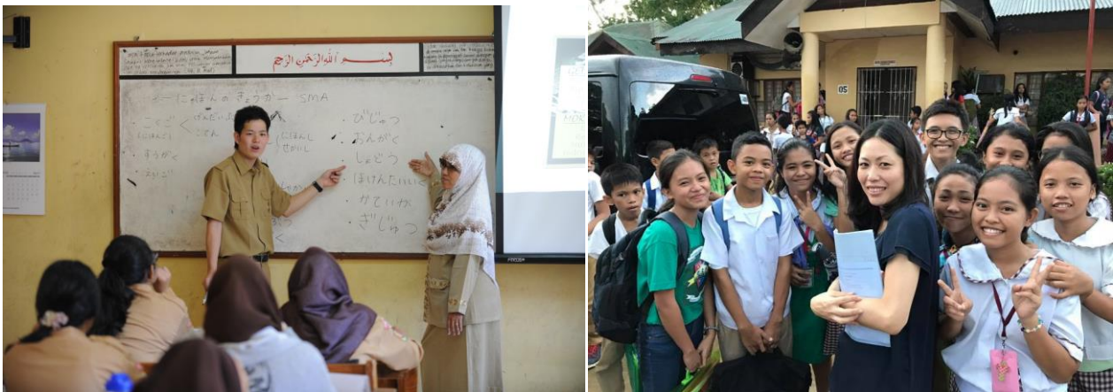
“日本語パートナーズ”活動風景（写真左：インドネシア、写真右：フィリピン）

国際交流基金（ジャパンファウンデーション）は、ASEAN 諸国を中心とするアジアの中等・高等教育機関などで、現地の日本語教師と学習者のパートナーとして、各国の日本語教育を支援する“日本語パートナーズ”派遣事業を実施しています。派遣開始から 4 年目を迎え、この度、“日本語パートナーズ”の派遣人数が 1,000 人を突破したことをお知らせいたします。