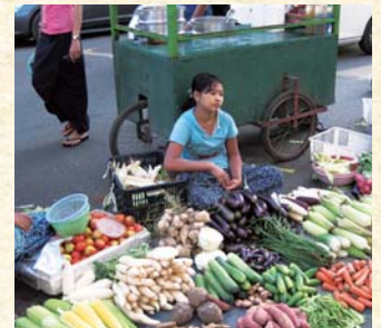
ミャンマー・ヤンゴン