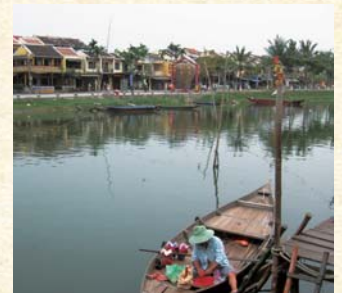
ベトナム・ホイアン