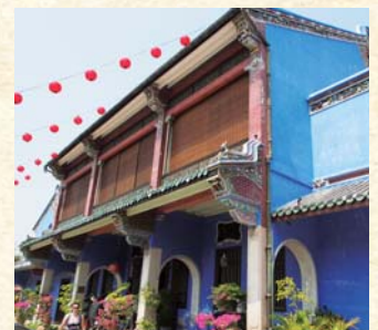
マレーシア・ペナン