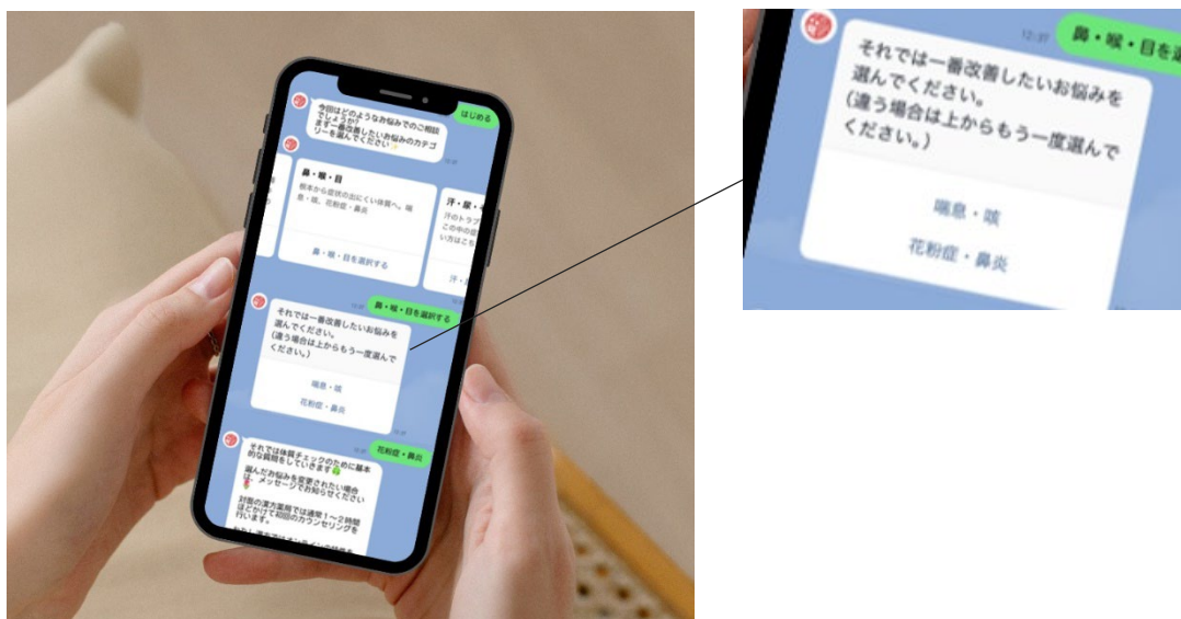
②回答をもとに、漢方薬剤師がお悩み・体質に合わせた改善プランを提案

利用方法：①LINEで無料体質チェック（URL： https://page.line.me/jrw6198k?openQrModal=true ）