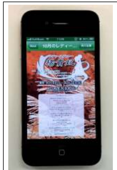
▲サービスを開始したiPhone版ユーカリが丘アプリ(電子チラシを表示した状態)

ユーカリが丘アプリシステムの配信する情報は、今回リリースされる「iPhone版ユーカリが丘アプリ」の他、NTT東日本が開発した多世代向けタッチパネル端末「光iフレーム」、地域密着型情報アプリケーション「ユーカリが丘 CommuCs for Android」、月間20万回の閲覧数があるユーカリが丘地区最大の地域情報サイト「ユーカリが丘公式タウンポータルサイト」で閲覧することができ、月間約4万人が利用しています。