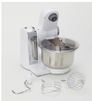
BOSCHコンパクトキッチンマシンと アタッチメント3種

本体重量はわずか2.9kg、駆動部を折りたたむことができるため、使うときだけ収納から取りだし、終わったらしまう、という使い方も可能です。