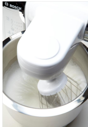
BOSCHコンパクトキッチンマシン MUM4415JP

1886年にロバート・ボッシュがドイツで創業した精密電気製品メーカーのボッシュ社は、日本では車の部品や電動ドリルで有名ですが、1930年代に冷蔵庫を製造して家庭用電化製品市場へ参入して以降、家電製品市場で確かな地位を確立しています。現在では、世界最大級の総合家電メーカーのひとつです。