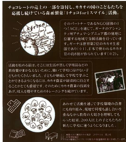
中面（二つ折り/キャンペーン趣旨記載）