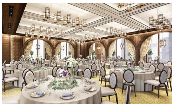
< バンケット > ※イメージ図