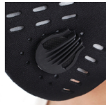
呼吸が苦しくなりにくい 逆止弁バルブ採用