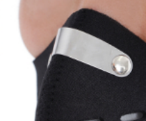
アルミ製ノーズクリップ