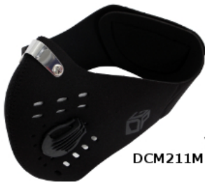
ダストシールドマスク DCM211M-BK / DCM211L-BK