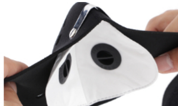
花粉捕集効率99.9%、0.1µmの粒子を99.9%以上カットする高性能フィルター