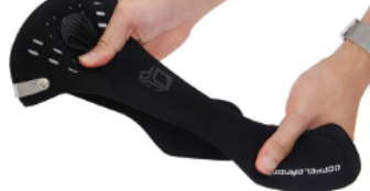
伸縮性の高いネオプレン素材