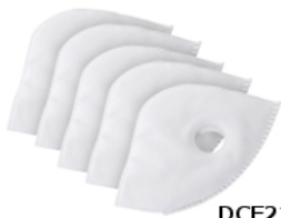
ダストシールドマスク 専用交換フィルター DCF212M-WH / DCF212L-WH